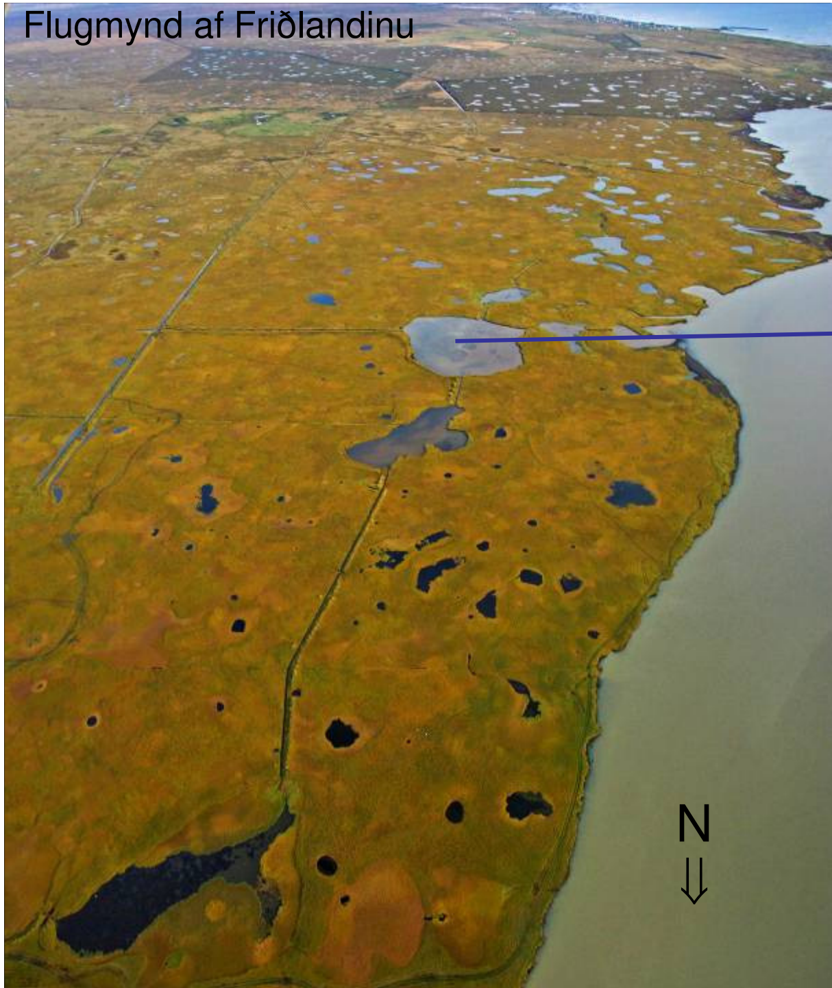
Flugmynd af Friðlandinu