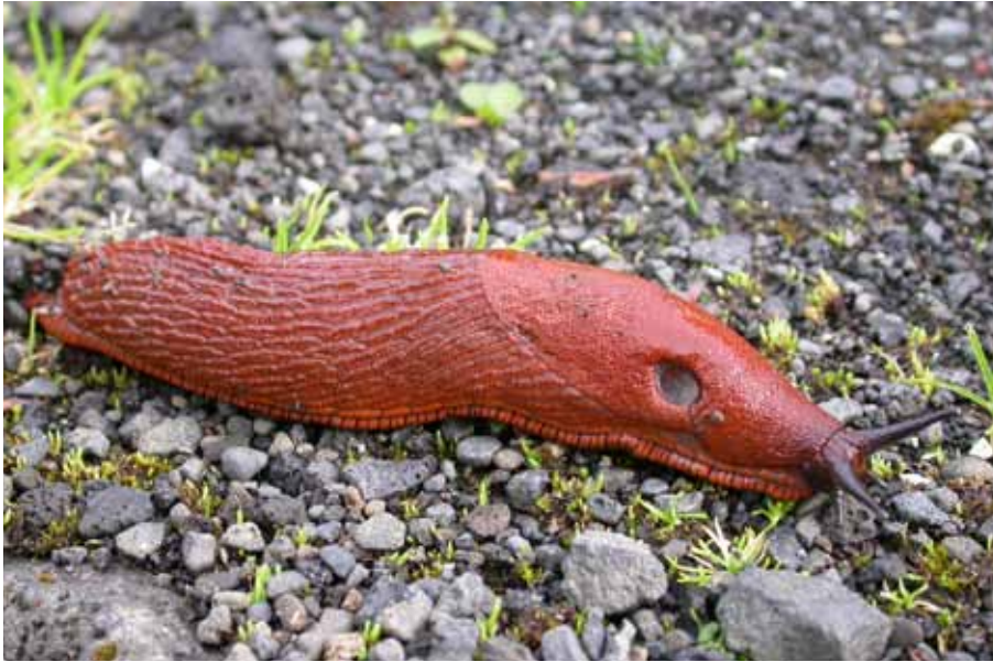
Spánarsnigill nýlegur vágestur.

framandi tegunda. 429 Skýr löggjöf og skilvirk stjórnsýsla er því einn af lykilþáttum markvissrar náttúruvendar. Með aðild Íslands að samningnum um líffræðilega fjölbreytni hafa íslensk stjórnvöld tekið á sig skuldbindingar og þarf íslensk löggjöf að endurspeglar þær skyldur. Í skýrslu Ríkisendurskoðunar, „Samningurinn um líffræðilega fjölbreytni“, frá árinu 2006 eru gerðar athugasemdir við hversu takmörkuð áhrif aðild að samningnum hefur haft á íslenska löggjöf og opinbera stefnu á sviði líffræðilegrar fjölbreytni. Þar kemur fram að einstakar lagagreinar eða ákvæði miði að því að innleiða ákvæði samningsins en sú innleiðing virðist nokkuð tilviljunarkennd og ómarkviss. Einnig er gerð athugasemd við að ábyrgð á vernd líffræðilegrar fjölbreytni sé óskýr innan íslenskrar stjórnsýslu. 430