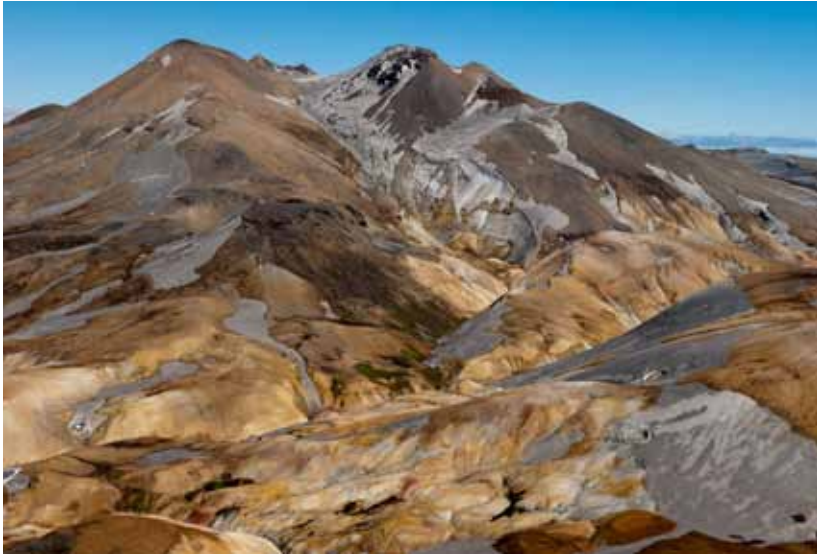
Fannborg og Hverahnúkur í Kerlingarfjöllum.

ræktaðar eru í görðum né um plöntur sem ræktaðar eru í ylrækt þegar litlar sem engar líkur eru á að framandi lífverur berist út í náttúru landsins eða þegar um er að ræða tegundir sem ekki geta lifað í íslenskri náttúru og þar með ekki ógnað líffræðilegri fjölbreytni.