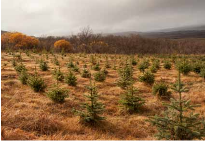
Framandi tegundir í skógrækt.

sé því meðmæltur og að stranglega sé fylgt fyrir mælum laganna og reglugerða sem settar eru á grundvelli þeirra. Málsmeðferð er mismunandi eftir því hvort um er að ræða nýjar dýrategundir eða erlenda stofna tegunda sem hér eru fyrir annars vegar eða tegundir sem hér eru fyrir hins vegar.