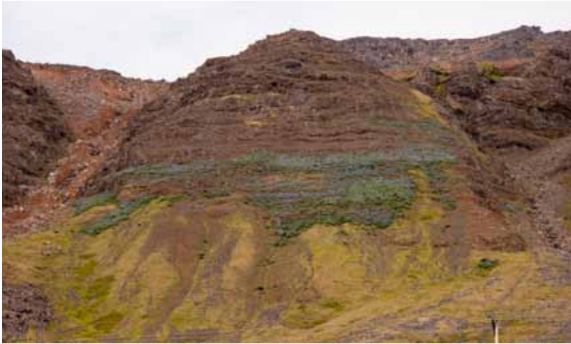
Lúpína í fjallshlið.

að ekki náist heildaryfirsýn yfir málaflokkinn og að stjórnvöld verði óskilvirk. Slíkt fyrirkomulag er ekki vel til þess fallið að tryggja vernd lífríkis landsins og uppfylla skuldbindingar þess efnis sem íslenska ríkið hefur undirgengist með aðild að ýmsum alþjóðlegum samningum.